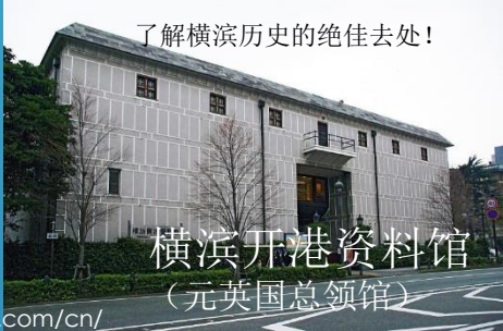
横滨开港资料馆 （元英国总领馆）