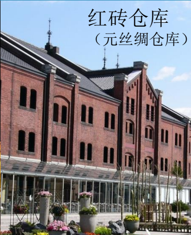
红砖仓库 （元丝绸仓库）